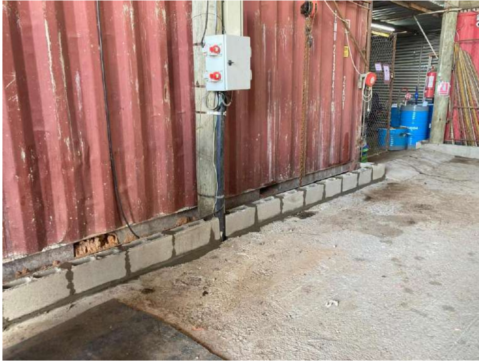
Imagen N°9: Instalaciones del taller mecánico.