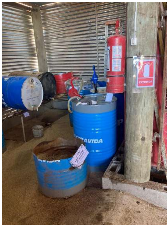
Imagen N°7 y 8: Recinto de productos químicos y residuos peligrosos.