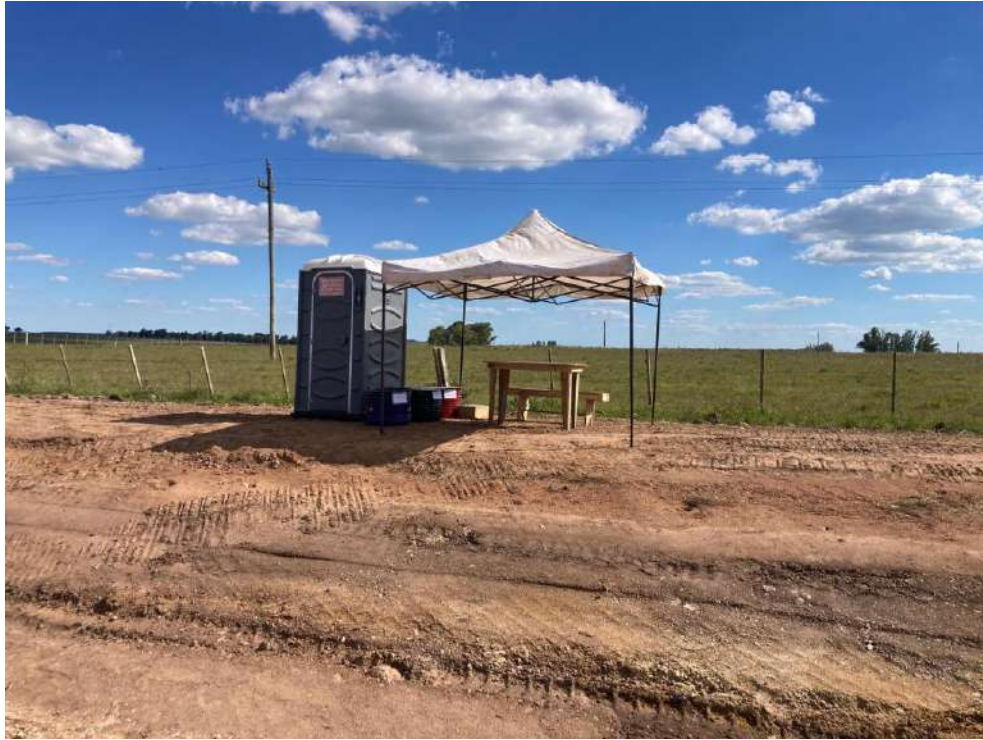
Imagen N°11: Zona de resguardo en frente de trabajo.