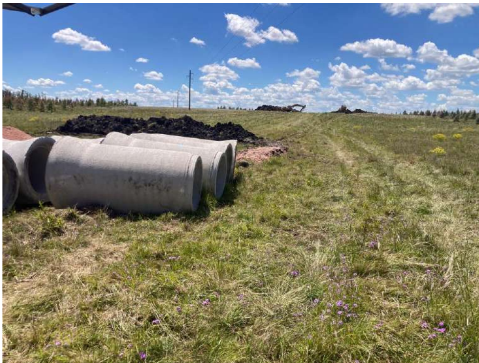
Imagen N°15: Inicio en zona de expropiación Progresiva 10+400.