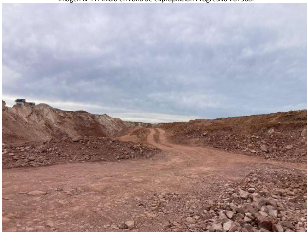
Imagen N°18: Cantera de obra pública en el padrón 10680 de Durazno.