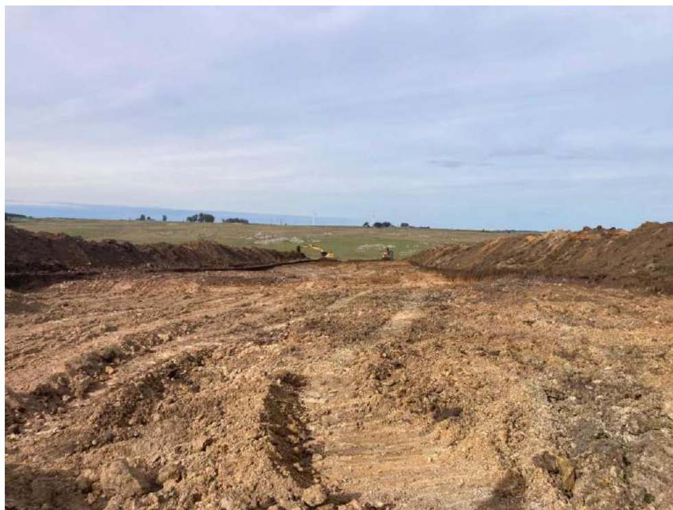
Imagen N°17: Inicio en zona de expropiación Progresiva 26+500.