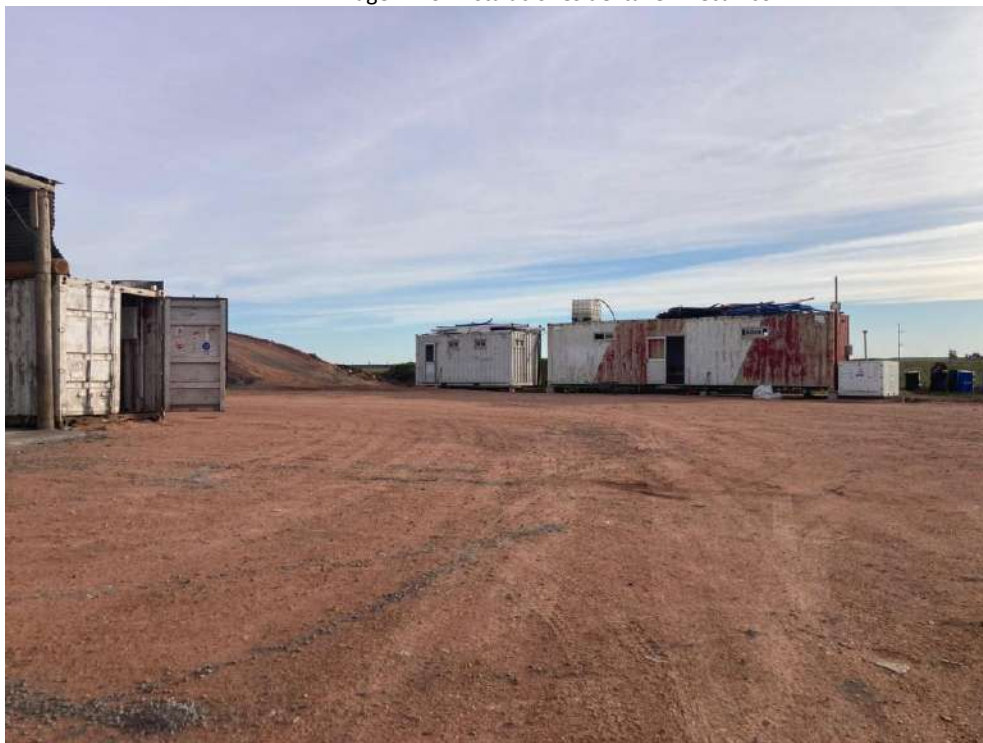
Imagen N°10: Instalaciones de baños.