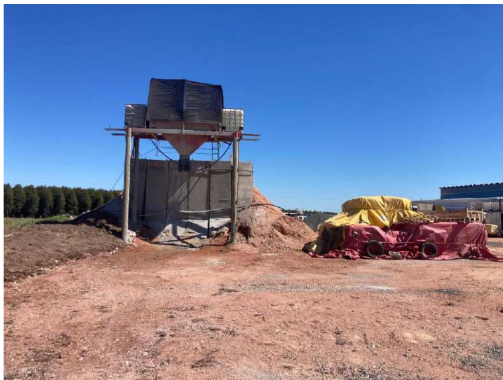
Imagen N°5: Planta de producción de hormigón semiautomática.