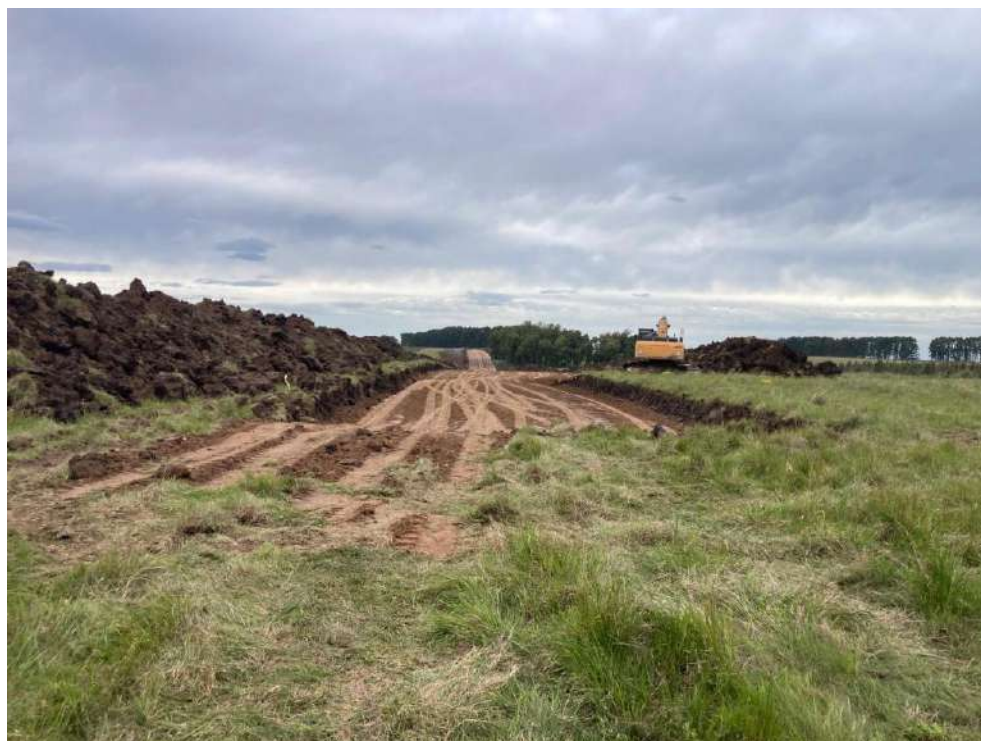
Imagen N°13: Zona de expropiación Progresiva 10+700.