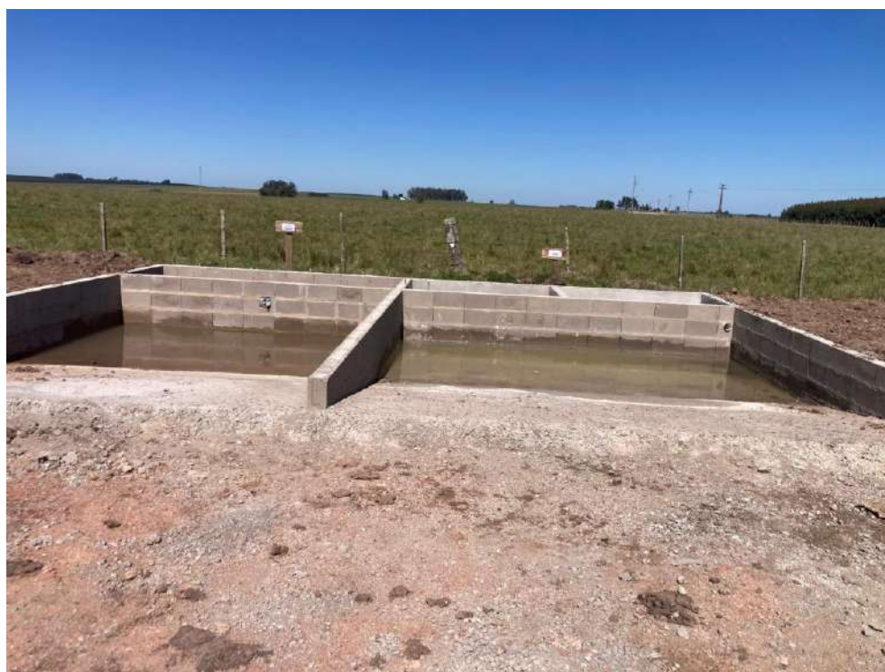
Imagen N°4: Piletas de lavado de mixers y herramientas con hormigón (derecha) y piletas de efluentes de máquinas y camiones (izquierda).

Se presentan imágenes del obrador y de los frentes de obra para el trimestre de referencia.