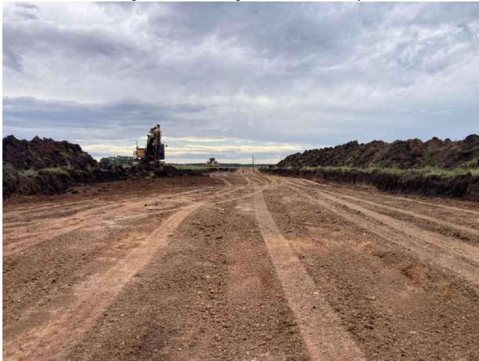
Imagen N°12: Zona de expropiación Progresiva 10+700.