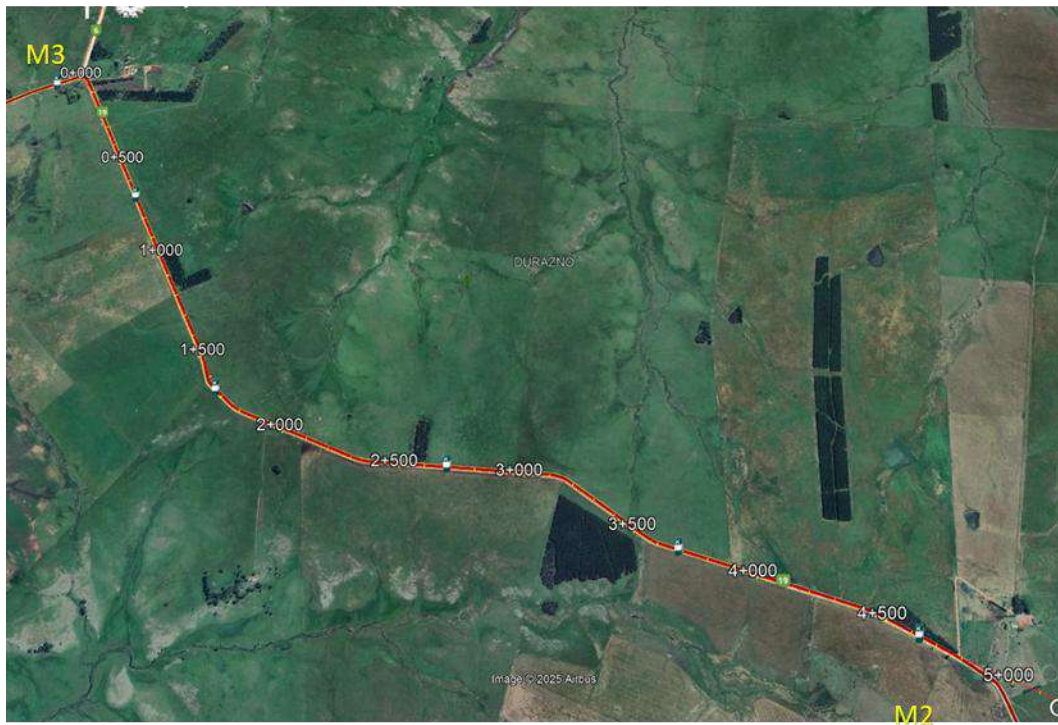
Imagen N°2 y 3: Ubicación de mediciones de ruido.